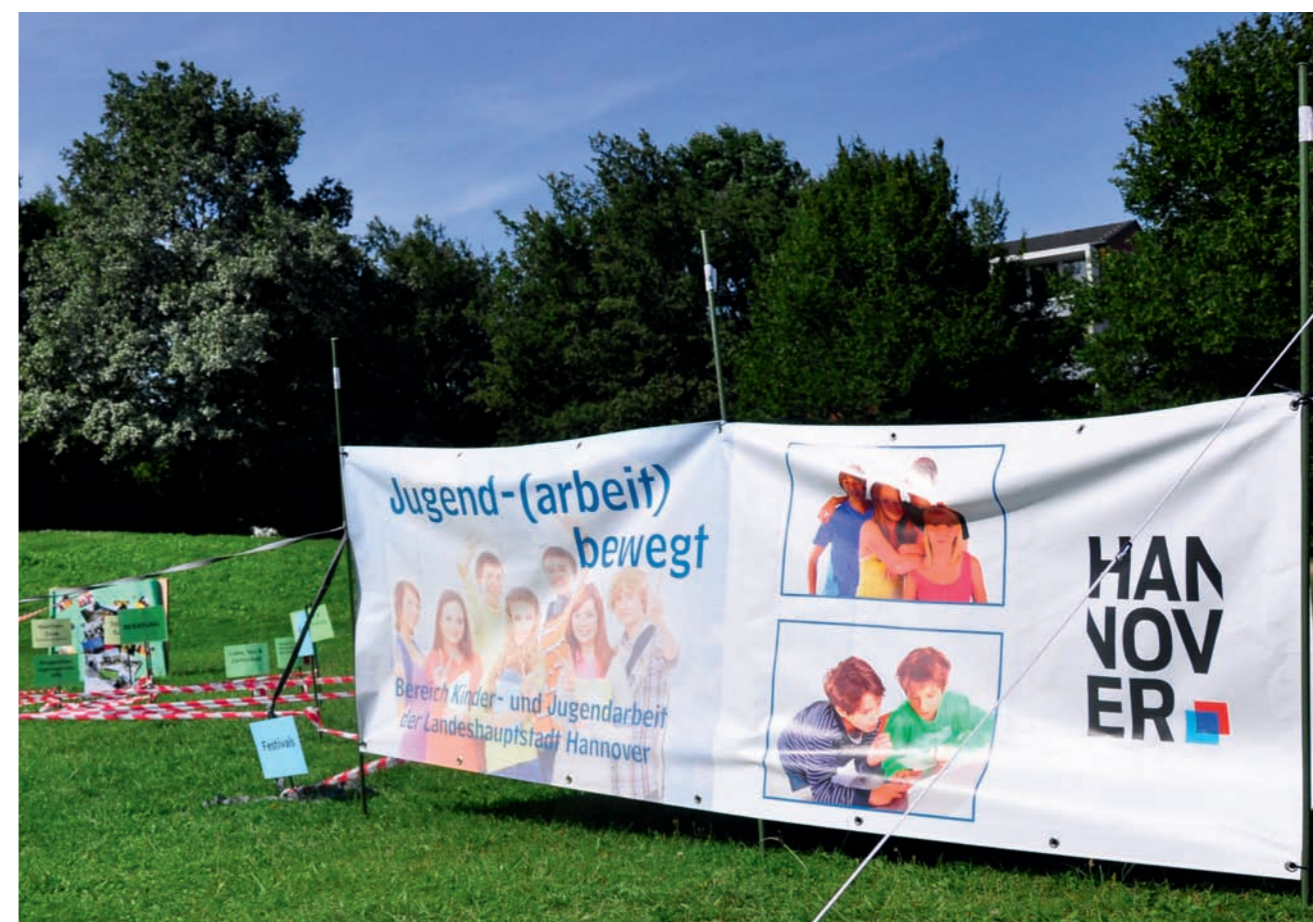
Begehbare Ausstellung »Jugendzentrum und ju:an-Praxisstelle antisemitismus- und rassismuskritische Jugendarbeit«

Die Ausschussvorsitzenden haben keine besondere Macht. Sie laden zu den Sitzungen ein und können nach bestimmten Regeln Mahnworte erteilen, jedoch haben bei Abstimmungen ihre Stimmen nicht mehr Gewicht als die der übrigen Ausschussmitglieder. Wichtiger hingegen ist die Symbolkraft: Die AfD macht Realpolitik und möchte mitgestalten. Dass diese Gestaltung keine emanzipatorische ist, dürfte klar sein. Der Stadtjugendring zeigte sich entsetzt und wertete das Ergebnis als eine Abwertung der Jugendpolitik. Viele Positionen der AfD stehen denen der Jugendverbände und -ringe diametral gegenüber.