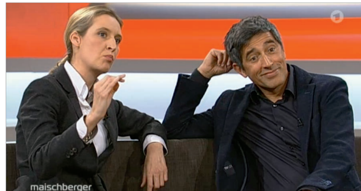
Alice Weidel zu Gast in der Sendung »Maischberger« zum Thema »Angst vor Flüchtlingen: Ablehnen, ausgrenzen, abschieben?«. Neben ihr der ARD-Moderator Ranga Yogeshwar.

Wir als Journalist_innen ordnen ein, analysieren, und wir