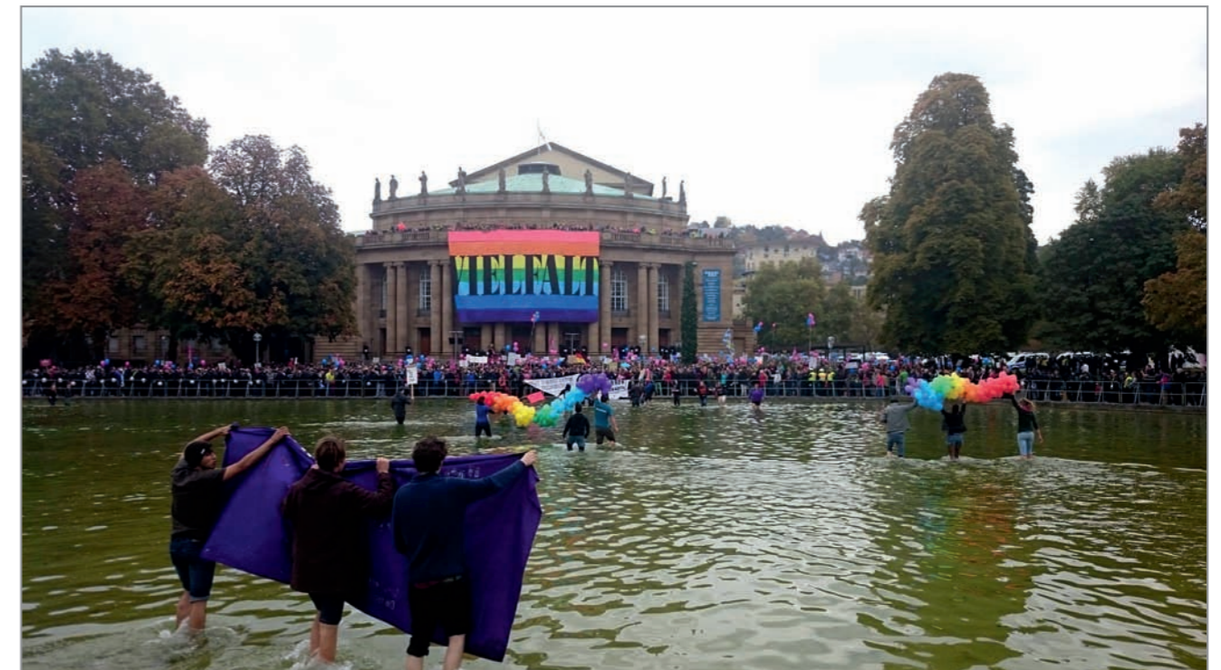
Das Staatstheater Stuttgart spannte am 11.10.2015 an seiner Fassade ein Riesenbanner in Regenbogenfarben auf, als Zeichen gegen eine Demonstration zum Thema »Ehe und Familie vor – Stoppt Gender-Ideologie und Sexualisierung unserer Kinder!«