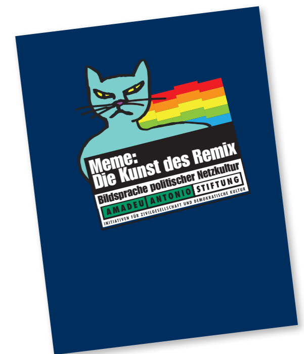
Meme: Die Kunst des Remix. Bildsprache politischer Netzkultur, Amadeu Antonio Stiftung, Berlin 2016, www.amadeu-antonio-stiftung.de/w/files/pdfs/meme-internet.pdf

Die zunehmende Enthemmung in den sozialen Netzwerken trifft jüdische und muslimische Menschen, Schwarze Menschen und Menschen mit Migrations- oder Fluchtgeschichte, Feminist_innen, Lesben, Schwule und Trans* Menschen besonders hart. Sie verdienen die Solidarität aller Menschen, denn ein Angriff auf sie ist ein Angriff auf eine pluralistische und vielfältige Gesellschaft.