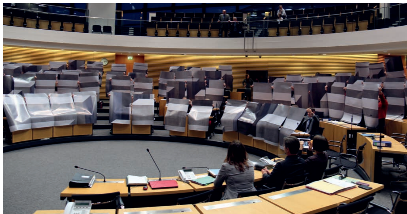
Die Landtagsabgeordneten von Linke, SPD, Grüne und CDU im Thüringer Landtag reagierten mit einer gemeinsamen Aktion auf die Dresdner Rede von Thüringens AfD-Fraktions- und Parteichef Björn Höcke. Sie hielten Plakate in die Höhe, die jeweils einen Teilausschnitt des Berliner Holocaust-Denkmal zeigen.